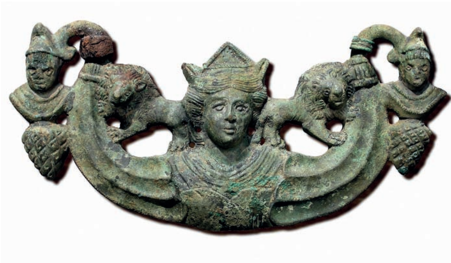
Fig. 2. Poignée métroaque, bronze, Famars, II-III e siècle apr. J.-C.