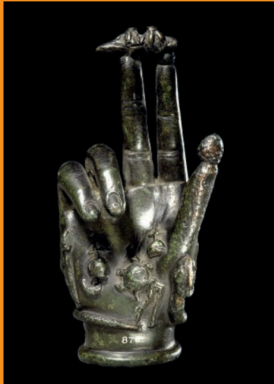
Fig. 12. Main sabaziaque, bronze, Tournai, II-III e siècle apr. J.-C.