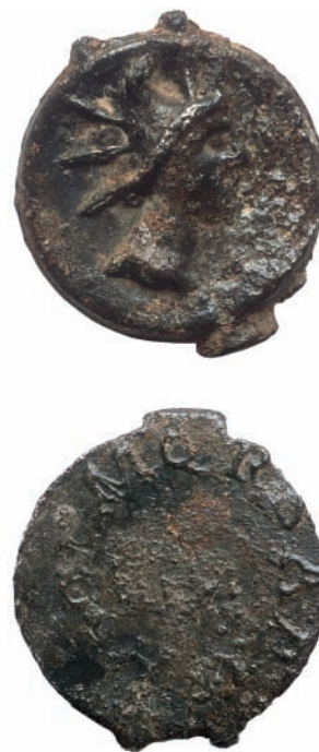
Fig. 10. Tessère mithriaque, étain, Liberchies, II-III e siècle apr. J.-C.

L'intérêt pour le culte de Mithra inspire d'autres interprétations douteuses. G. Faider-Feytmans a ainsi décelé des motifs mithriaques dans la « pierre aux quatre divinités » de Fontaine-Valmont, qui servait, à la fin du II e siècle, de socle à une colonne au cavalier à l'anguipède implantée à l'endroit précis où la cité des Tongres touchait celle des Nerviens 111 . Sur les trois faces conservées, on reconnaît Junon accompagnée d'un paon, Vénus nue tenant un manteau, et Apollon archer en course au-dessus d'un autel. De la dernière face perdue nous est parvenu un dessin montrant un aigle dressé sur une sphère ornée de deux bandes croisées. S'il est vrai qu'un globe similaire figure sur l'autel d'un Mithraeum d'Heddernheim et qu'un Apollon archer voisine peut-être avec Mithra sur un relief de