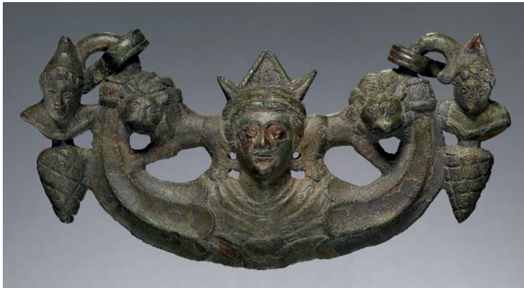
Fig. 5. Poignée métrouaque, dite du «Nord de la France», bronze, II-III e apr. J.-C.

Ainsi que l'avait déjà noté Cumont 51 , une telle répartition incite à désigner Bavay comme centre de fabrication de ces poignées. Toutes présentent le même montage iconographique. Au centre, un grand buste frontal de Cybèle, drapée, coiffée d'une couronne à trois pointes, dont la plus large est parfois décorée de petits cercles, émerge d'une sorte de corolle végétale. Ses épaules semblent se perdre de chaque côté dans une sorte de corne d'abondance renversée et cannelée qui supporte un lion, debout de profil, avec la gueule vue de face. Les deux fauves sont tournés tantôt vers la tête de la déesse, tantôt vers les extrémités des ornements recourbés. Celles-ci se terminent par un petit buste d'Attis, drapé, coiffé du bonnet phrygien, et enté sur une pomme de pin. Notons, au-delà de ce schéma fondamental, qu'aucune de ces poignées n'est dans le détail identique à une autre, ce qui suggère l'existence de plusieurs modèles. Leur origine locale transparait dans un style un peu lourd, se manifestant par exemple dans la rondeur des visages. La déformation des motifs, comme la coiffe de Cybèle, peut-être une couronne tourelée stylisée, qui n'est pas sans rappeler la Cybèle-Nehalennia de Boulogne-sur-Mer, reflète aussi la main d'artisans nerviens romanisés.