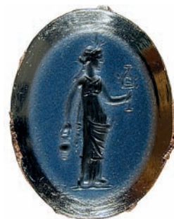
Fig. 9. Intaille à l'effigie d'Isis debout, agathe nicolo, Liberchies, II e siècle apr. J.-C.

Dernier venu sur la scène romaine, le dieu d'origine perse Mithra semble faire son apparition en Occident dans le sillage des soldats revenus victorieux des campagnes de Corbulon en Arménie, bien que les pirates ciliciens capturés par Pompée en 67 av. J.-C. avaient déjà pu l'y introduire. Quoi qu'il en soit, Rome le connaît à l'époque flavienne, en particulier sous Domitien, lorsque le poète de cour Stace évoque, en sa Thébaïde , celui qui «sous les rocs de l'ancre persique, tord les cornes du taureau récalcitrant» 99 . À partir du II e siècle apr. J.-C., les sanctuaires mithriaques se multiplient à Rome, où l'on en compte une quarantaine, et à travers l'Empire.