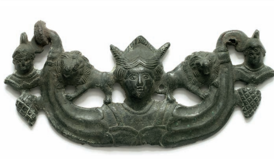
Fig. 3. Poignée métroaque, bronze, Chapelle-lez-Herlaimont, II-III e apr. J.-C.

plausible qu'un nouvel exemplaire (fig. 2) y a été mis au jour en 2008 lors des fouilles de l'INRAP 46 .