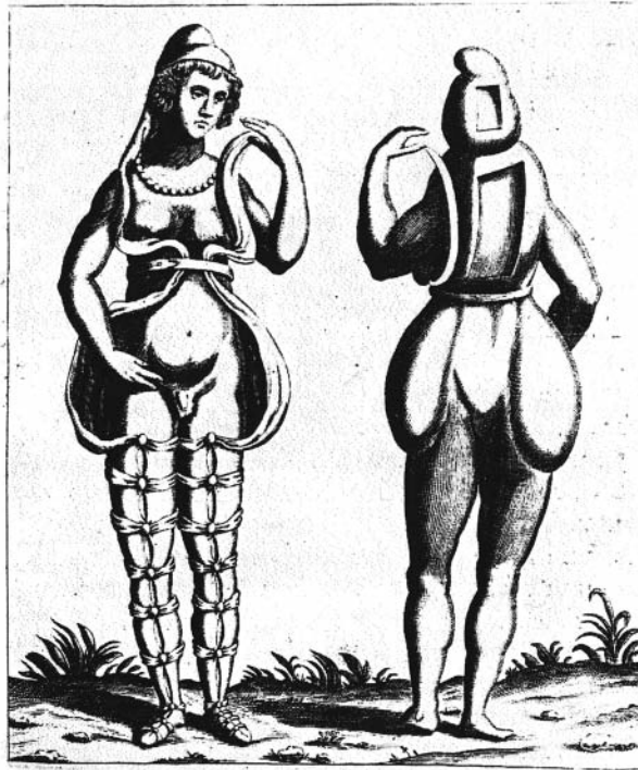
Fig. 6. Gravure d'une statuette d'Attis, Tournai, II-III e siècle apr. J.-C., d'après L. PIGNORIUS, Magnæ Deum matris idææ et Attidis initia. Ex vetustis monumentis nuper Tornaci erutis , Paris, 1623, pl. I).

une couronne murale 59 . À Turnacum (Tournai), en pays ménapien, si l'épithaphe découverte en 1821 sur la Grand-Place ne commémore très probablement pas le souvenir du passage d'un archigalle 60 , une statuette en bronze d'Attis pourrait toutefois y attester une présence métrouaque. Ayant appartenu à la collection du chanoine Denis de Villers, elle n'est connue que par un dessin (fig. 6) reproduit par L. Pignorius à Paris en 1623 61 . Son authenticité a été mise en doute 62 en raison d'anomalies, comme une androgynie accentuée, qui ne sont peut-être dues qu'à la fantaisie du graveur (ou de Pignorius lui-même) interprétant quelque peu un Attis dansant, le corps revêtu d'une tunique et du long pantalon oriental (anaxyrides), laissant apparaître le bas du ventre 63 .