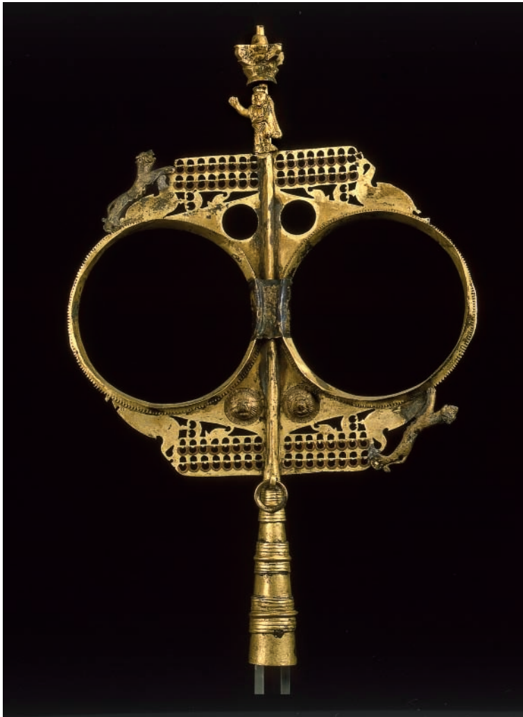
Fig. 8. Enseigne avec statuette de Sérapis, cuivre, laiton et bronze doré, Flobecq, II-III e siècle apr. J.-C.

médailles à masque de lion et quatre panthères en bronze doré. Au sommet, un chapiteau composite surmonte une statuette de Sérapis debout en bronze doré, haute de 6,8 cm, fixée à la tige par deux anneaux mobiles. Vêtu d'un chiton et d'un himation , coiffé d'un calathos , le dieu barbu tient un bâton de la main gauche et lève la droite, paume ouverte, à la hauteur du visage en signe de salut ( adlocutio ), mais aussi de protection. Deux des cinq enseignes de ce type connues par ailleurs sont aussi décorées de statuettes divines. Le dieu qui les surmonte n'est toutefois pas, comme on a pu le croire, Dionysos, mais le Genius iuventutis . L'une d'elles, trouvée à Pollentia (La Alcudia) sur l'île de Majorque, porte, en outre, non seulement une Fortuna et une Diane, mais aussi une Isis reconnaissable à son basileion 93 . La présence de Sérapis sur l'enseigne flobecquoise n'est donc pas surprenante. Souvent associé au culte impérial aux II e et III e siècles, le dieu a, par ailleurs, très bien pu