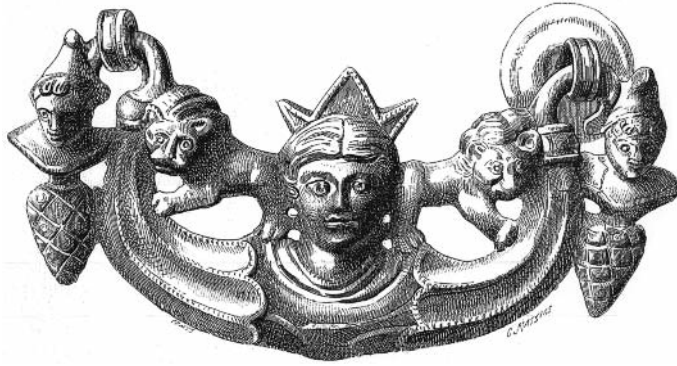
Fig. 4. Gravure d'une poignée métrouaque, d'après W. FROEHNER, Collection Julien Gréau: Les bronzes antiques décrits , Paris, 1885, p. 18, n° 63).